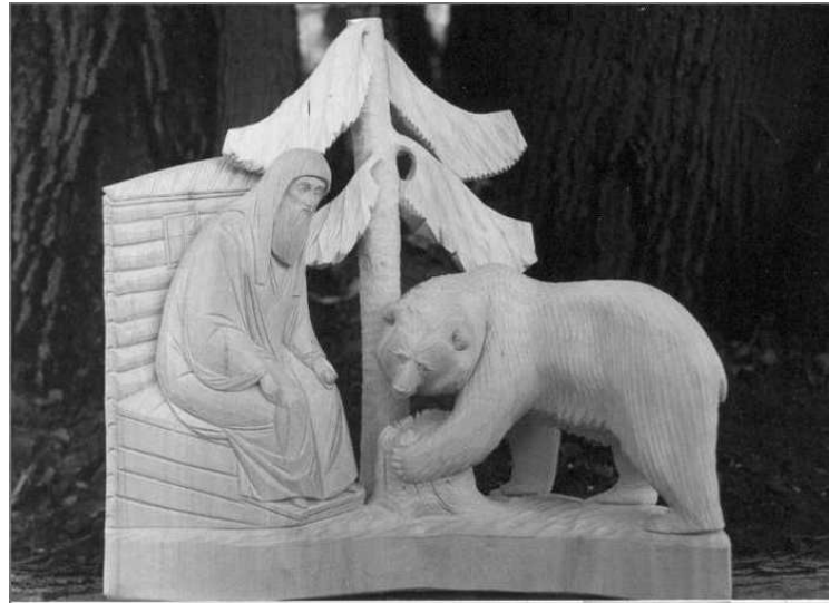
2. Богородская игрушка, XIX век, мелкая пластика