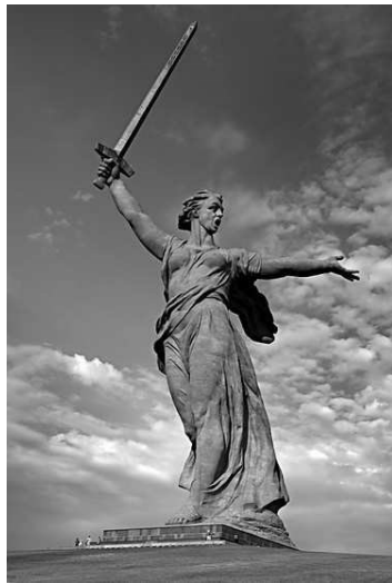
3. «Родина-мать зовёт!» Е.В. Вучетич. Волгоград, XX век, монументальная скульптура