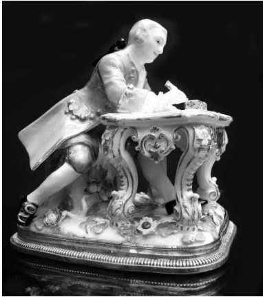
1. Кавалер за рабочим столом. Мейсенский фарфор, XVIII век, мелкая пластика