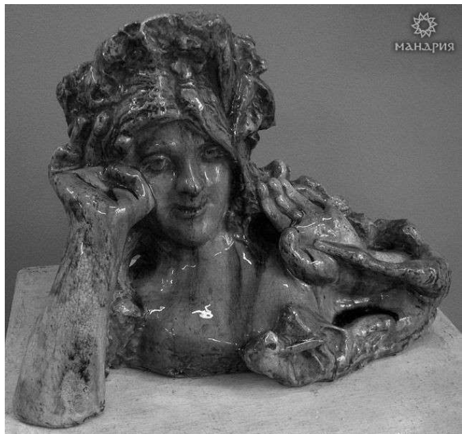
8. «Весна» Михаил Врубель. Майолика.