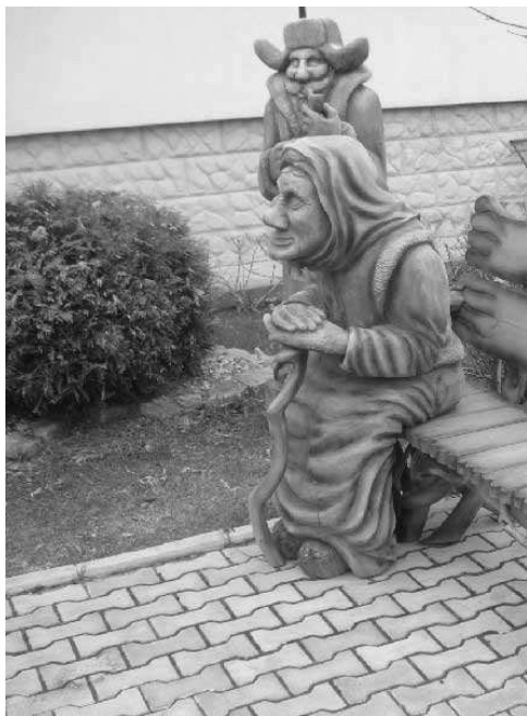
7. Современная садовая скульптура, XXI век, Россия