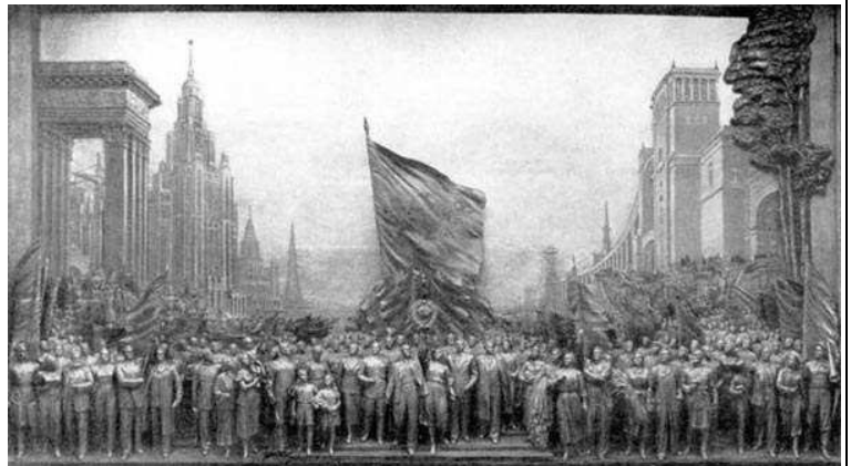
4. Е.В. Вучетич и др. Горельеф, XX век. «Советскому народу, знаменосцу мира – слава!»