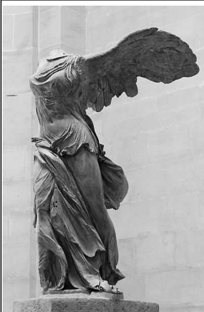
5. Ника Самофракийская (II в. до н. э.) – древнегреческая мраморная скульптура, эпоха эллинизма